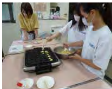
9/6 ベビーカステラ作り