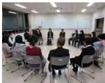
11/8 先輩の話を聞こう